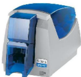
(プラスチックカードプリンタ)